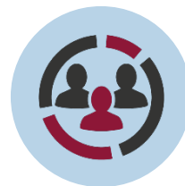
Rassemblements de retraités