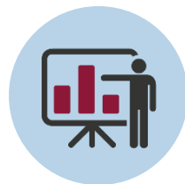
Présentations à la conférence annuelle