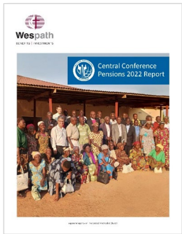
Bienal Relatório do programa CCP