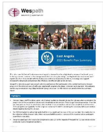
Bienal Cartas de síntese do bispo