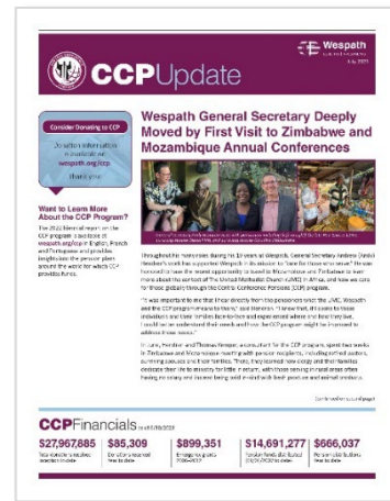
Boletim informativo CCP